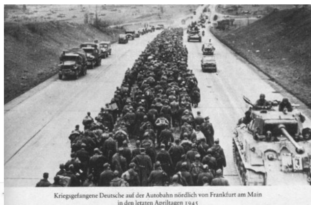
Kriegsgefangene Deutsche auf der Autobahn nördlich von Frankfurt am Main in den letzten Apriltagen 1945